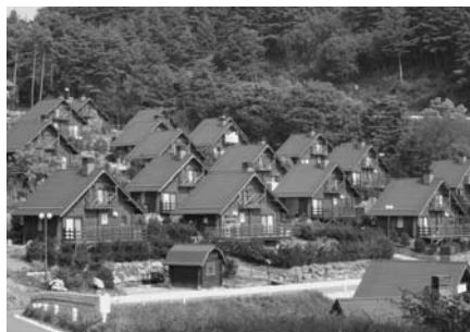
松本市のクラインガルテン

答 香取市を視察した段階では市自体が開園者になるという前提で視察は行っていない。休耕農地の活用には、非常にいい方策だと考えているので、今後、実際に開園者になる立場で香取市のみならず、他県も含めて十分な研究、検討をしていく。