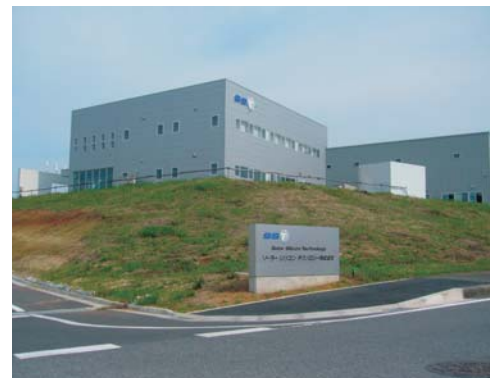
ソーラーシリコンテクノロジー(株)

上記の結果、木更津市への立地及び立地協定締結企業は合計15社(民間7社・公的8社)となりました。