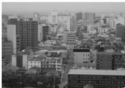
太田山から見た市街地

答 マニフェストに掲げたとおり若者や子供が「故郷きさつ」に住み、より豊かに暮らせるようにするため、未来に希望を持ち、安心して定住できるまちを目指したいと考えている。そして、東京湾アクアラインを十分活用し、都心とのアクセス性に優れ、また、豊かな自然と触れ合うことができる活気あふれる街、川崎市や横浜市などの対岸とは異なる本市独自の魅力を持つ、情緒あふれる「みなとまち木更津」を目指していきたいと考えている。