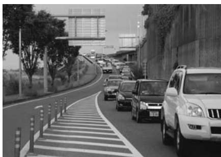
アクアライン連絡道の渋滞

答 アクアライン連絡道の側道部分については、国道409号と位置付けされており、その管理は国土交通省千葉国道事務所が行っている。木更津市としては、過