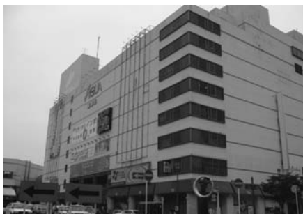
アクア木更津ビル

答 木更津市はNSKへの債権者ではなく、駅前ホールなど施設の共益費を支払わなければならない債権者である。しかし、債権者である木更津観光物産(株)に対しては、調査、質問、資料提供などの権利を有している。同社を通して今後も対応していく。木更津観光物産(株)としては、まず、今も営業を続けている55のテナントが営業を継続できるようにすることを最優先にし、同社が持つ損害賠償及び債権については、NSKの代理人弁護士を通じ、アクアの経理状況、再生計画等の情報把握に努めるとともに、弁護士等の指導を得ながら慎重に対応している。と聞いている。