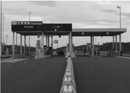
木更津東インターチェンジ

本会議の全容を記録した会議録は、行政資料室・図書館・公民館などで閲覧することができます。また、インターネットによる、検索・閲覧も可能です。