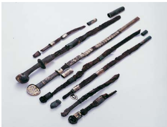
企画展 ~ 発掘された木更津 ~ 8月30日まで開催中 『郷土博物館 金のすず』