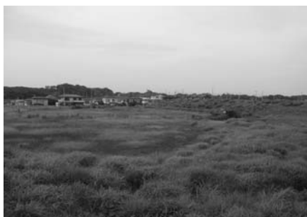
(仮称)真舟中学校用地

答 学校予定地の利活用については、木更津市立小中学校適正規模等審議会にゆだねたい。予測数値については住民基本台帳に基づいて推計しているが、予測に含まれない社会増や、近隣の土地画事業等の伸展により、さらに社会増の影響が予想される。