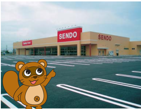
完成した大規模小売店