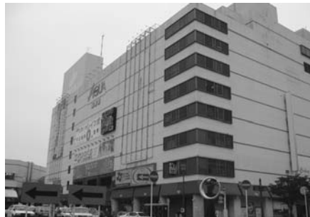
アクア木更津ビル

平成22年度予算編成について アクアラインを活用した地域振興について アクア木更津について 残土条例の制定について