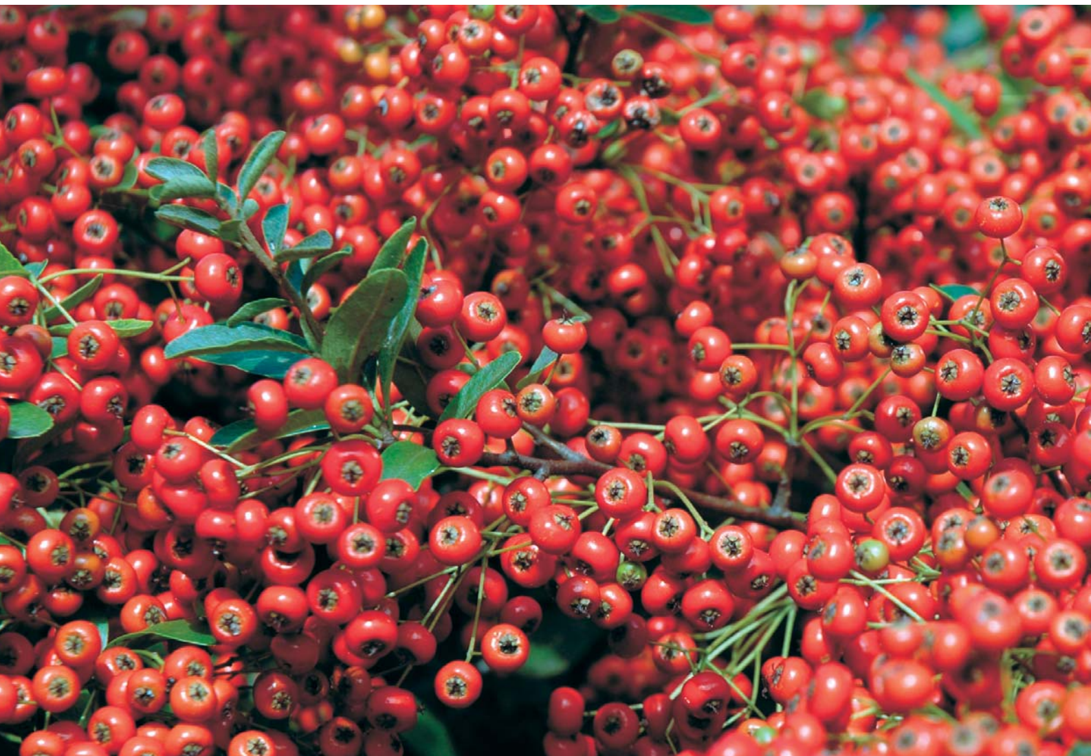
深まりゆく秋（ピラカンサス）