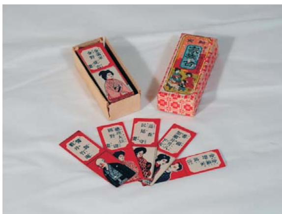
体験展 ~むかしの遊び~ 12月6日まで開催中 『郷土博物館 金のすず』