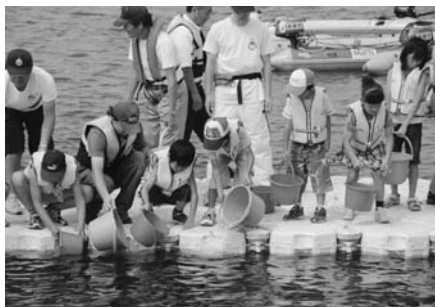
みなと木更津うみ祭り

問 アクア木更津に「道 の駅」を開設し、「きさらづ 海の駅」を含む「みなとオ アシス木更津」と運動させ ていけば西口中心市街地の 活性化に繋がるものと考え る。みなとオアシス木更津 の現状と今後の方向性は どうなのか 答 NPOや市民団体と ともに、対岸のポルトユー ザーの誘致を目的とする体 験ツアーや観光船誘致を目 的とした花火大会クルーズ、 緑地を生かした「はぜ釣り 大会」等を積極的に行って きた。本年度は、更に広域 からの集客を目指し、吾妻 地先の埋立地、通称「出島」 と呼んでいるが、その緑地 を活用し、9月26日、27日 は、中片町公会堂から県 道木更津富津線までの間 を平成17年度に拡幅整備 した。今年度、富士見通 りの宝家から中片町公会 堂までの未改良地区につ いて、歩行者の安全確保 の面からのカラー舗装等 の工事を行うが、今後、 高速バスの通行を考えて の改良が必要であると考 えている。