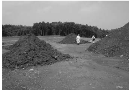
残土処分場の中間検査

問 新たな市独自「残土条例」の早期制定は、残土の埋め立てをめぐる問題を抱えている地区住民からの熱い要望であり、行政にとっても急務である。急ぐことは勿論、同時に「土壌の汚染及び災害の発生防止」という目的を達成するには、どのようなふさわしい内容にするかということが一番重要な点ではないか。まず、新条例制定の進捗状況と今後のスケジュールは 答 順調に作業が進んだ場合、12月市議会定例会での所管委員会、議員全員協議会において条例案の骨子を説明し、その後、パブリックコメントを実施、3月 問 市議会定例会へ議案を上げし、施行までの周知期間を設けた後に実施していく。 問 新条例の骨格、特徴は 答 現在調整中だが、要点としては、土地所有者の同意、隣接地所有者の同意、周辺住民の承諾を盛り込んだ条例を策定していく予定である。 問 住民の声を聞く方法は、パブリックコメントだけか 答 パブリックコメントにより市民の意見を聞きながら、本市の実情にあったものを策定するのが肝要だ。山間部、谷が多いといった地形上の問題、また、これまで他県からの残土運搬は、海上ルートが多かったが、アクアラインの値下げにより陸上ルートも多くなると考えられる。本市特有の状況にあった条例の策定についてどのように考えているか 答 本市の条例も本市特有の状況を十分加味したものにしたい。