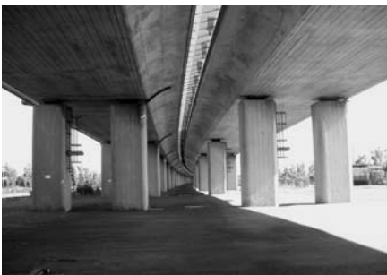
アクアライン連絡道高架下