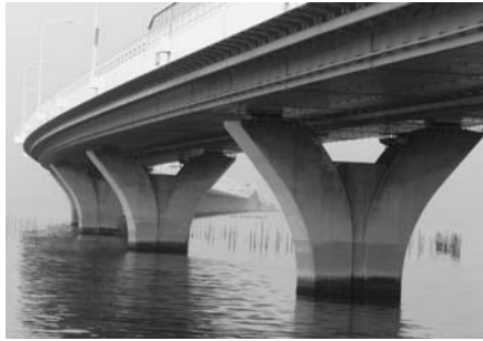
東京湾アクアライン

来訪者の増大、対岸市民の本市への居住促進、対岸企業の進出促進などを図ることにより、地元経済が活性化し、本市商業の繁栄に繋がるものと考えている。 問 アクアライン800円の値下げが、高速バスの料金に反映するのか 答 バス事業者によると、通行料金の値下げにより、通行量が増え、渋滞が発生し、定時運行が確保されないことから、バス利用者の減少が進み、前年比約3から10%、1便当たり約1.5から3人減少しているとのこと。社会実験により、大型車の通行料金は2千500円安くなるが、東京便の片道運賃は1千300円であり、1便当たり2人の利用者が減少すると通行料金の値下げ分を上回るため、運賃の値下げには反映できないとともに、運行の遅延により運転手の拘束時間が増えるため、人件費の増加など、運行に係る経費が増大することとなり、現時点での運賃の値下げについては難しいとの回答であった。