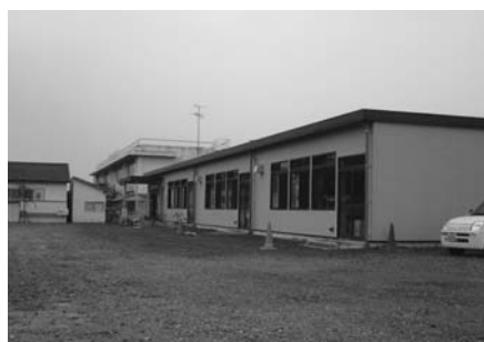
軽量鉄骨で増設した南清小学校

市長の政治姿勢について 教育環境の整備について みなと木更津再生構想について 東京湾アクアライン800円を踏まえた地域の活性化について