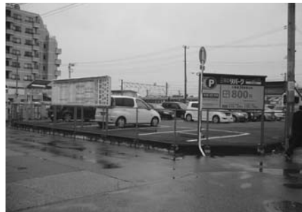
旧ミナミポウル跡地の駐車場

問 市が土地開発公社から普通財産として買戻した土地のうち、平成15年取得で2箇所、平成17年取得で2箇所、都合4箇所は、なぜ利活用されていないのか。また、今後の利活用の予定があるか 答 東中央二丁目13番6号と7号の土地は、旧ラズモール来客者用駐車場として、平成20年7月まで賃貸借契約を結んでいたが、契約が解除となり、立地条件も良いことから、本年度、一般競争入札による公売を予定している。次に、貝淵二丁目578番2の土地は、平成14年度まで介護支援を業とする民間業者の駐車場用地として活用していたが、利活用については、先の3月議会で質問したところ、処分を前提に庁内で協議するとの答弁だったが、利活用計画は 答 現在、木更津一番街商店街振興組合に駐車場用地として貸しているが、今後、駅周辺の街づくりとしての活かし方や、地域活性化のための有効な活用を念頭に、また、最終的な選択肢としての売却も含め、幅広い視点から研究したい。