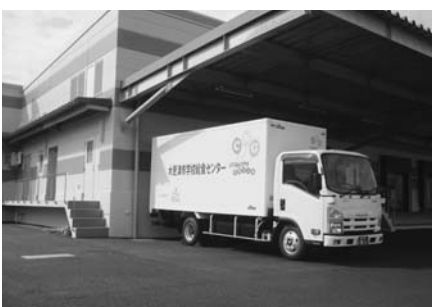
木更津市学校給食センター

答 9月4日現在で、4月の徴収率は99.77%、5月は99.64%、6月分は99.34%である。7月分については、準要保護の未納分が納付されたものと計算すると98.31%となる。6月、7月の徴収率が低いのは、夏休みに入り、未納の家庭と連絡が取りづらくなったことが原因と考えられる。未納家庭への対応は、毎翌月10日の納期限までは、学校ごとに納付のお願い、徴収を行ってもらっている。納期限以降は、給食センターにおいて督促通知を送付している。今後、未納家庭に対して電話による督促はもちろんのこと、家庭訪問などを行い、滞納対策に努めたい。