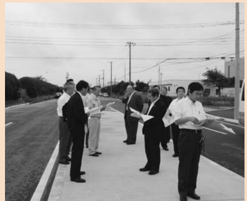
現地調査（潮浜地区の市道改良事業）