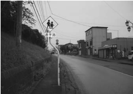
畑沢地区の通学路

答 市道133号線は、畑沢小学校、畑沢中学校、波岡小学校の通学路として、登校時間帯は、大型貨物車通行止めが交通規制がされている。また、市道134号線も同様の交通規制がされている。また、港南台一丁目入口の交差点には、この先、2km、午前7時から午前9時まで、大型貨物車通行止めの標識があるので登校時間帯に大型貨物車が進入できない状況にある。今回の要望書の内容は、三校の通学路である市道133号線について、小学校低学年の下校時間帯である午後2時から午後6時まで、大型貨物車の通行規制が要望されている。今後は、地元要望実現に向けて、木更津警察署への働きかけはもとより、今回の事故が、大型貨物車運転手の信号無視が直接的な原因であることから、引き続き、関係機関・関係団体と連携し、交通ルールの遵守、安全運転の励行など、交通安全啓発活動を進めていく。