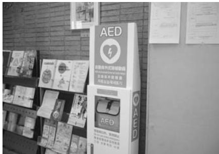
市役所に設置済みのAED

問 人が多く集まる所にはAEDはあつて当たり前、無くてはならない物というのが今の常識ではないか。公共施設や学校に設置されているAEDの数、場所について伺いたい 答 市役所、消防署、市民会館、市民総合福祉会館、保健相談センター、老人福祉センター、健康増進センター、中央公民館、清見台公民館、富来田公民館、市民体育館、市営球場、郷土博物館の各、小学校6校、中学校3校に設置されている。 問 市内小中学校の全校設置については、取組みが遅いように感じられるが現状はどうなのか 答 その通りである。 問 市民救命士の養成について、具体的な取り組みは 答 一般市民向けに定期的にAEDを使用した救命講習会を開催している。また、要請があれば市内の事業所や学校、自治会などにも出向いて、幅広く講習会を実施している。