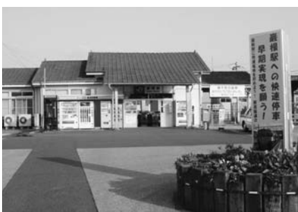
快速停車が望まれるJR巖根駅