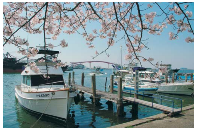
「第2回 みなとまち木更津八景」選定作品を順次紹介します。 作品名：春の木更津港 木更津は、約400年前から栄えてきた「みなとまち」です。