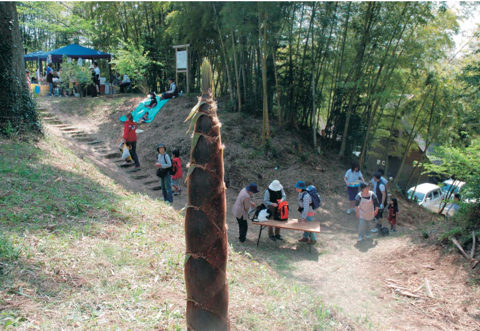
少年自然の家キャンプ場のたけのこまつり