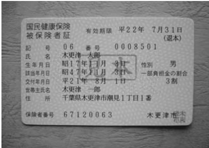
カード化された国民健康保険被保険者証

答 金田地区と巖根駅が最短で結ばれ利便性向上にはなる。まだ検討していないが、道路管理者の国土交通省千葉国道事務所と協議する方向で対応したい。