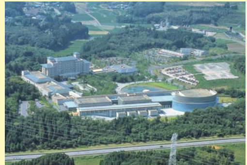
かずさアカデミアパーク

今後は、入札方式でスポンサーを募り、スポンサーの協力を得て再建に取り組むとのことであり、同社の施設に入居しているオークラアカデミアホテルなどは、通常通り営業しています。