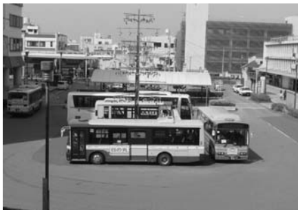
木更津駅前西口ロータリー

答 東口駅前広場は、バス、タクシィ、一般車が錯綜し、さらに、高速バスが大幅に増便し、容量を超えているため、トラブルが多発しており、バスやタクシィの事業者や市民からの苦情も多く、その改善が懸念