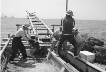
海苔養殖施設設置

答 1月6日に県からあつた意見照会に対し、市としては、住民の要望、意見、庁内関係課の意見を踏まえ、1月29日付けで県へ回答をしたところである。また、真里谷の自然を守る会では、昨年10月22日の3回目の説明会以後、事業に関する説明が不十分で、安全性などに未だに不安があることから、千葉工業大学の教授を講師に招き、勉強会などを開催し、土壌汚染、地下水汚染の恐ろしさ等を学び、改めて産廃最終処分場の建設は、反対であることを再確認したとのことであった。これについては、県へ2月15日に建設反対の要望書を提出し、同日市へもその旨報告を受けたところだが、この事前協議手続きは、今年29日