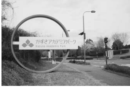
かずさアカデミアパーク

答 かずさアカデミアパーク事業は、アクアライン効果を広く地域に波及させることを目的として推進されたプロジェクトである。アクアラインが使いやすくなった今こそ、これまでの投資を地域に活かすことが