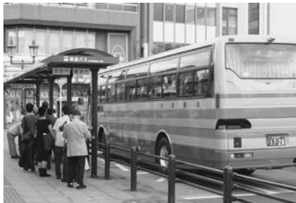
木更津駅を出発する高速バス

への通勤者が2千776人、神奈川への通勤者が627人、合計で3千403人となっている。その後の本市の定住促進策により、東京・神奈川からの転入者も増えてきているので、これ以上の方がいるのではないかと考えている。本市から東京・神奈川に通勤している方の通勤手当の実態については、把握していないが、「木更津暮らし応援会」などを通じて、対岸に勤務する数名の方から通勤手当の実態について聴取したところ、アクアライン高速バスの通勤定期代金額が、通勤手当として支給されているとのことであった。鹿児島県薩摩川内市の「新幹線通勤定期購入補助制度」や広島県安芸太田町の「高速道路通勤補助制度」のように、定住促進を目的として、通勤費の一部を補助している自治体もあるが、まずは通勤定期の値下げについては、バス事業者に要請をするとともに、通勤手当の実態把握に努めた