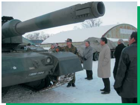
北海道北恵庭駐屯地

行政視察は、他の自治体が行っている施策等を調査研究し、本市の市民福祉の向上やまちづくり施策に活かそうとするものです。行政視察の調査項目は、委員会の所管事項に関し、各委員会で協議して決定しています。