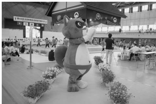
国体リハーサル大会（平成21年8月）

本年9月に「ゆめ半島千葉国体」相撲競技会を開催します。市をあげて国体参加者をお迎えしましょう。