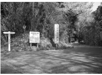
搬入路となる林道音信山線