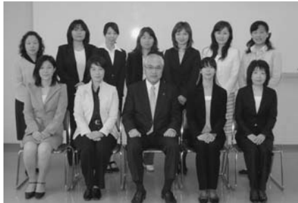
平成22年度スクール・サポート・ティーチャー

答 平成18年度から本市が独自に進めているスクール・サポート・ティーチャーを今年度は小学校9校、中学校1校に配置した。本事業は、まさに本市独自の職員採用の事業であり、他市には見られない取り組みとして、学校・保護者はもちろんのこと、内外から高い評価をいただいている。