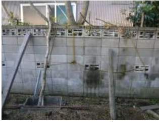
敷地南側の隣地境界ブロック塀