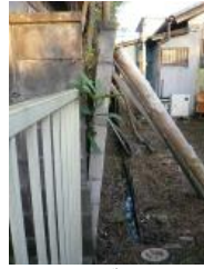
傾斜したブロック塀