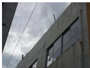
建物屋上の落下の危険のある部材