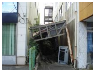
建物に隣接する木造付属屋