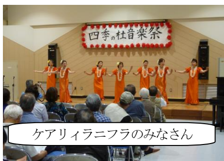
ケアリィラニフラのみなさん

6月23日(日)、八幡台公民館を会場に「第18回四季の杜音楽祭」が開催されました。昨年度は八幡台公民館の耐震補強改修工事の影響で開催できませんでしたので、1年ぶりの開催となります。八幡台公民館を利用している各音楽サークルは、この日を目指して熱心に練習を重ねてきました。当日の発表は、カラオケ、フラダンス、合唱、ブラスバンド、大正琴、ジャズダンス、ギター演奏など、盛りだくさんの内容でした。