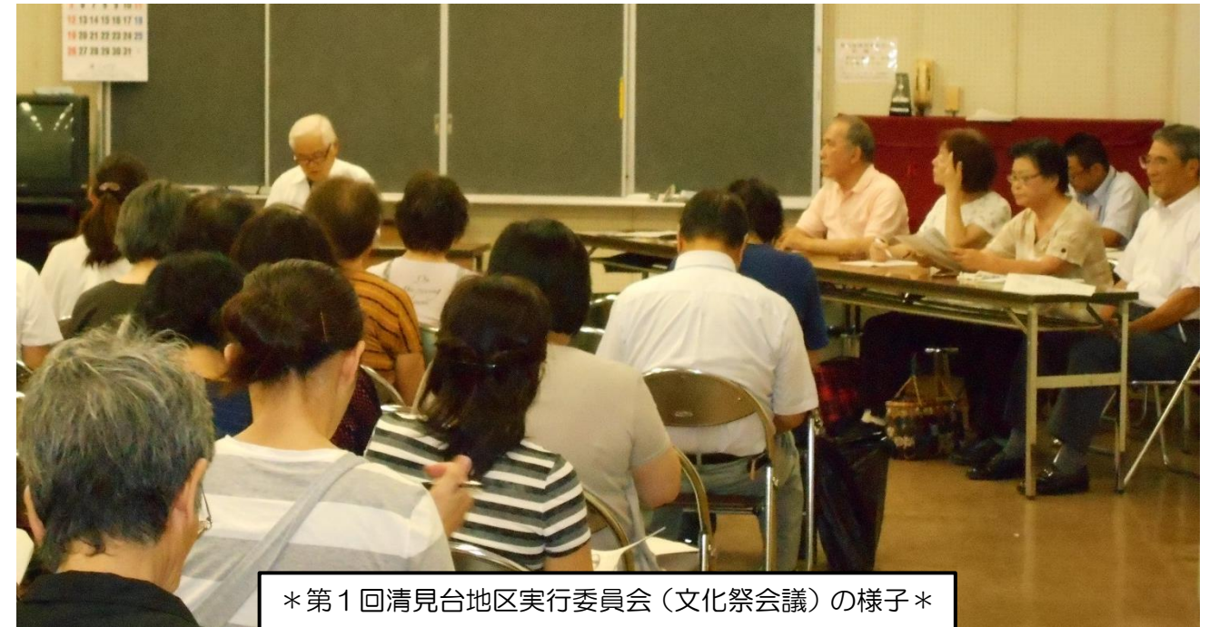
*第1回清見台地区実行委員会(文化祭会議)の様子*

去る9月3日(月)に、清見台公民館で第35回清見台地区実行委員会(第1回文化祭会議)が開催されました。