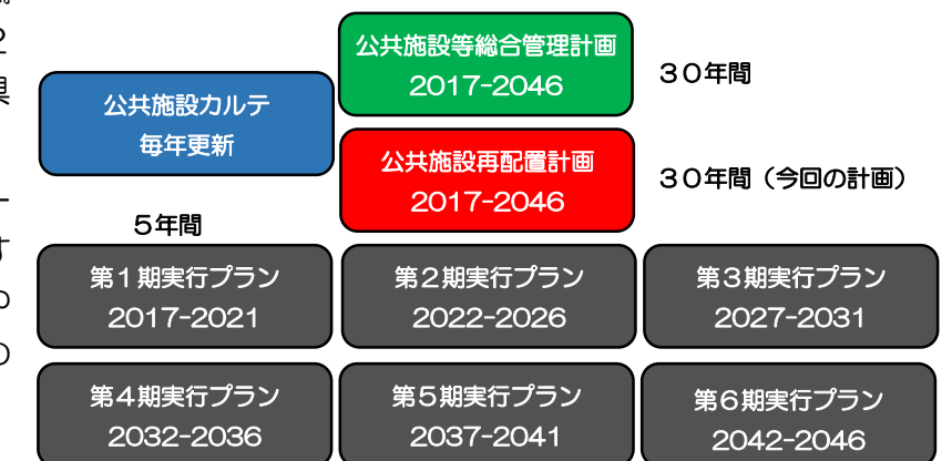
図表 2 第1期～第6期実行プラン

○分散管理している施設の維持管理は、一元化し「予防保全型」の維持管理を推進するための体制を構築します。また、建物や設備機器等を定期的に点検・診断するためのマニュアル作成等に取り組みます。