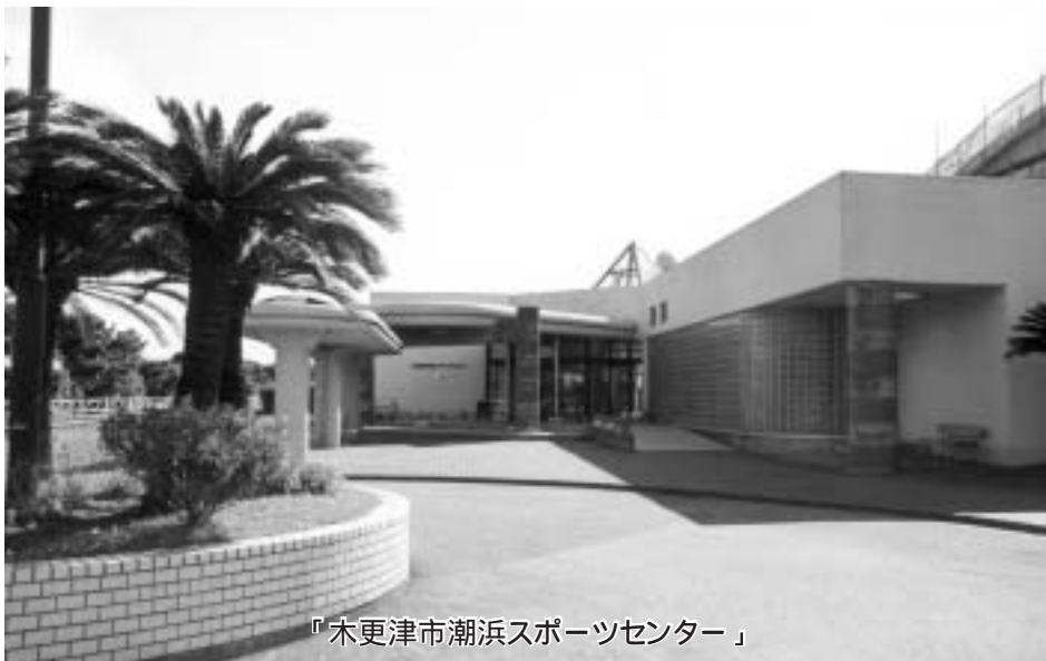
『木更津市潮浜スポーツセンター』