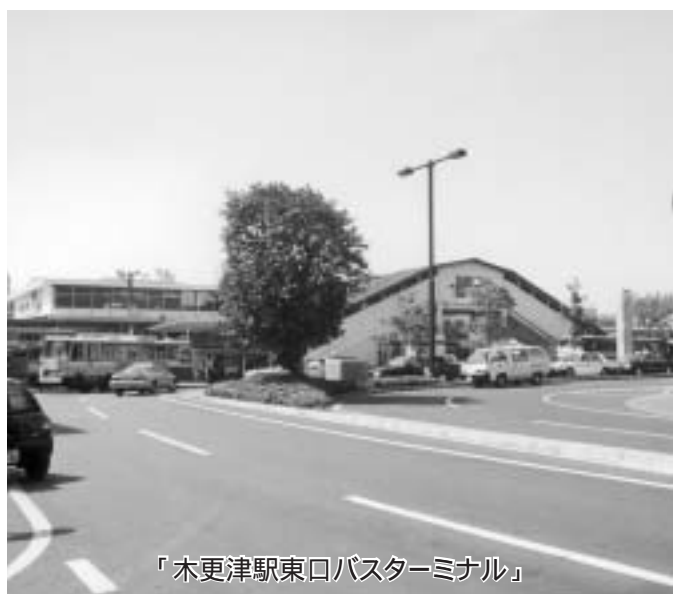
「木更津駅東口バスターミナル」

て、バスターミナルに供することの可能性についての計画検討をしていかなければならぬと考えている。