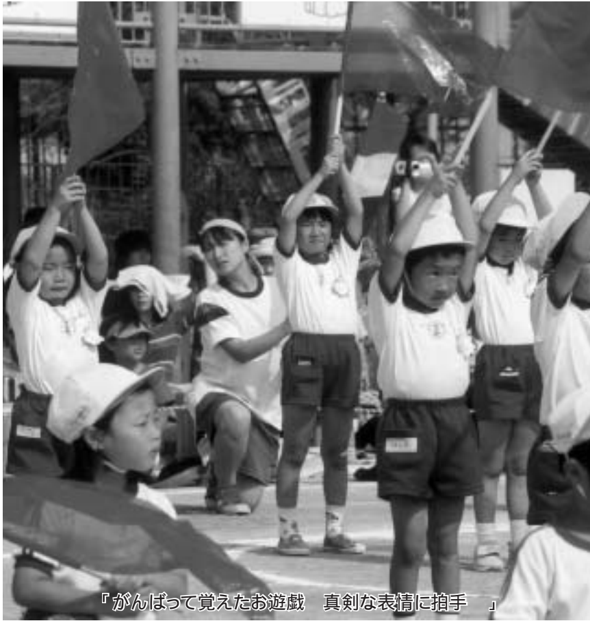
『がんばって覚えたお遊戯 真剣な表情に拍手』

http://www.city.kisarazu.chiba.jp/gikai/