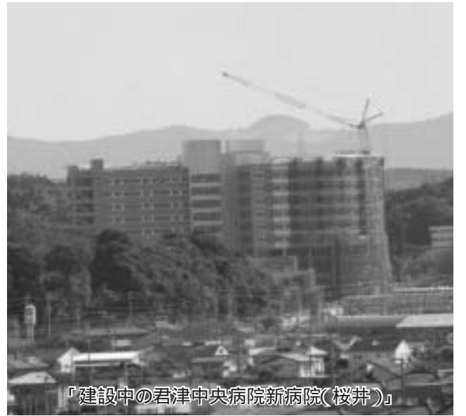
「建設中の君津中央病院新病院(桜井)」

また、本会議の全容を記録した会議録は、行政資料室・図書館・公民館などで閲覧することができます。