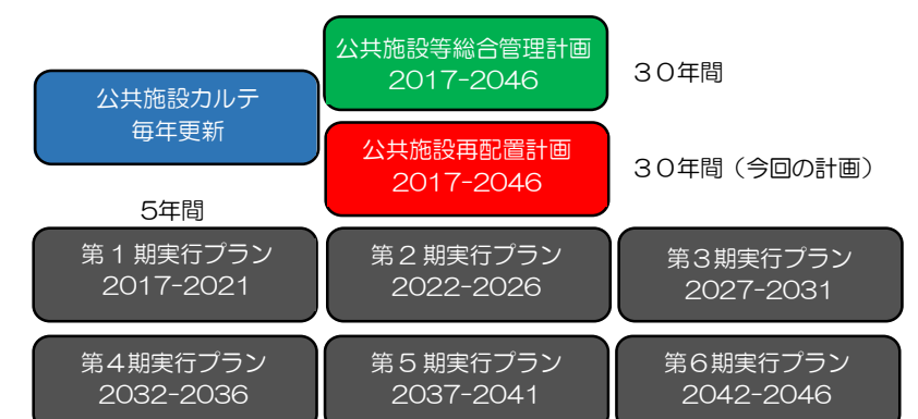
図表2 第1期～第6期実行プラン

○分散管理している施設の維持管理は、一元化し「予防保全型」の維持管理を推進するための体制を構築します。また、建物や設備機器等を定期的に点検・診断するためのマニュアル作成等に取り組みます。