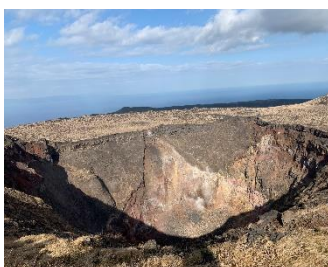
【大島の大迫力の火口】