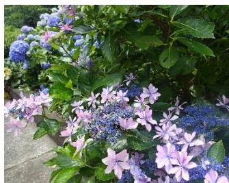
【大島のガクアジサイ】