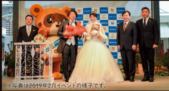
※写真は2019年2月イベントの様子です。

イオンモール木更津に来た方が証人となって人前結婚式を挙げませんか? ヘアメイク、衣裳もご用意します。これから挙式する方、結婚したけど式を挙げていない方、 お友達やご家族を呼んで手ぶらでできる結婚式です。