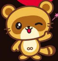
木更津市 マスコットキャラクター きさぽん