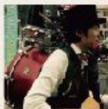
油ナジーン・ジーンマンバンド