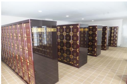
納骨室（埋蔵時のみ入室できます。）