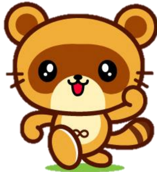
木更津市マスコットキャラクター「きさポン」