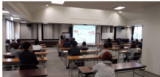
5/13（木）クラウドファンディング活用講座の様子