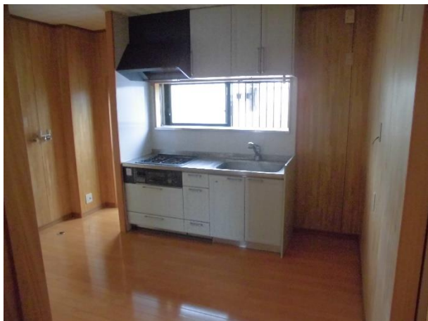
ダイニング・キッチン