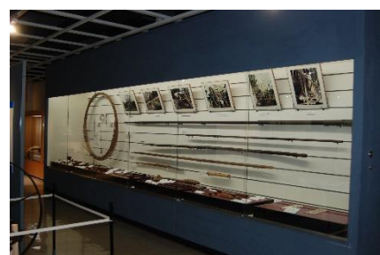
第9展示室「くらしの技術」 （上総掘りの用具など）