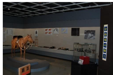
第2展示室「金鈴塚の輝き」