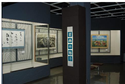
第5展示室「書画の魅力」

笹子城跡出土品（中世）、昭和20年の1年間を描いた木更津高等女学校生徒資料（近現代）、上総掘りの用具の一部（民俗）など、新たな常設展示資料もご覧ください。