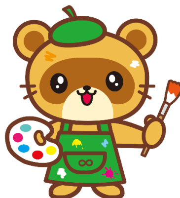
反転させたイラスト ❌