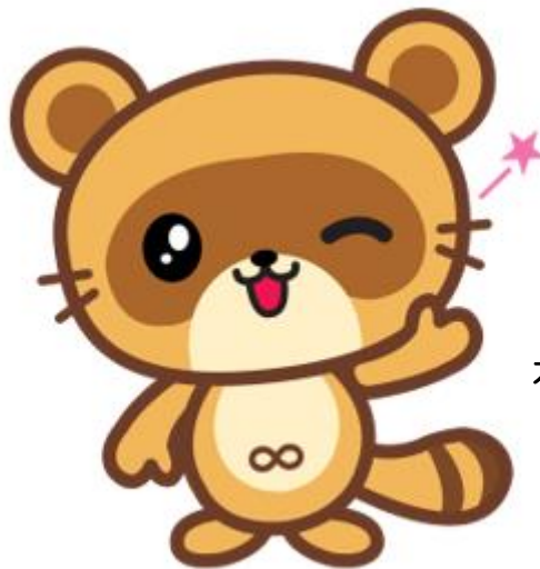
木更津市 きさポン