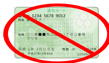
このカードは通知カードです。転出手続きでは使えません。