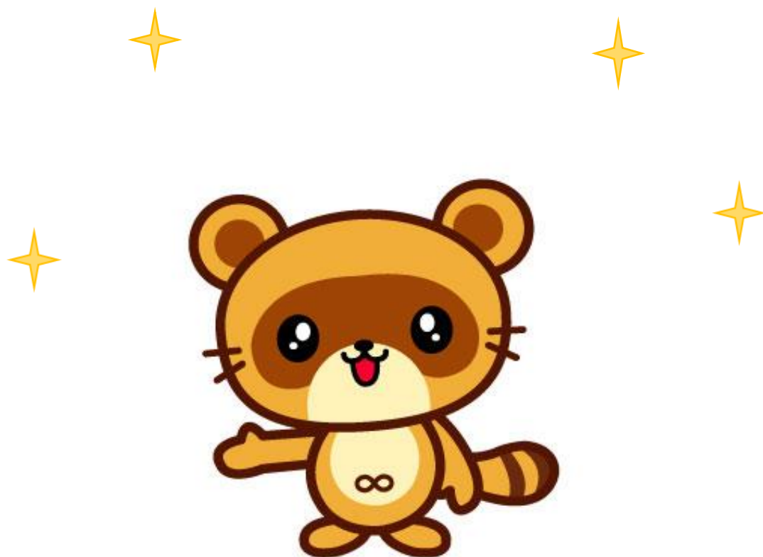
木更津市マスコットキャラクター きさポン