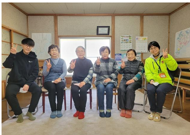
毎週火曜日 10:00～ 泉谷集会所で開催

年に1回の筋力アップ体操サークルの交流会も楽しみで、先日、継続を表彰してもらいました。表彰状は額縁に入れ、集会所に飾っています。