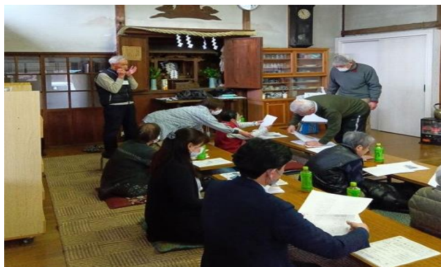
写真は「サロン西山」の様子です。

すでに仲間のできている場所に新たに飛び込むのは、なかなか勇気のいることだと思いますが、是非声を掛け合って参加してもらいたいです。地域づくりとして次世代に繋げ、できるだけ長く活動していきたいと考えています。