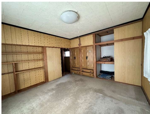
2 階 洋室 8 帖