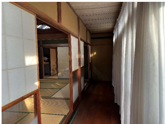
1 階 縁側