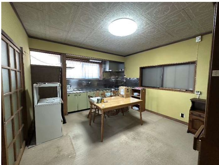
DK (ダイニングキッチン)