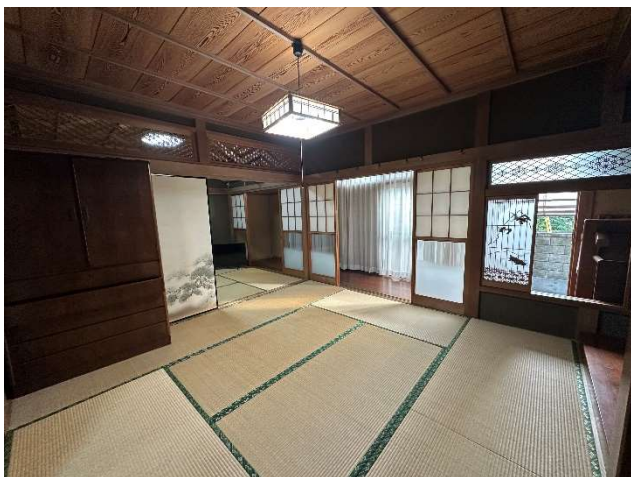
1 階 和室① 8 帖