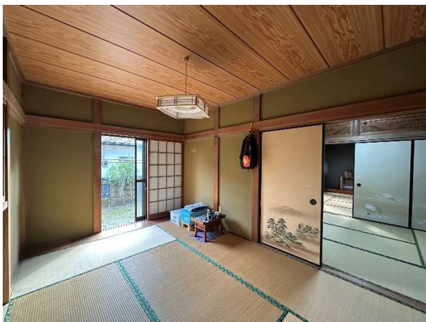
1 階 和室③ 6 帖