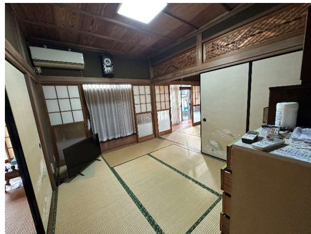
1 階 和室② 6 帖