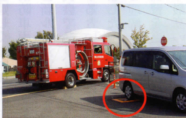
消火栓の上に車が止まっているため、消防自動車が消火栓を使用することができません。