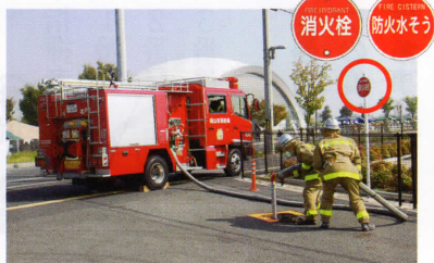
消火栓は、消防自動車が吸水しやすいように、道路脇や歩道上に設置されています。