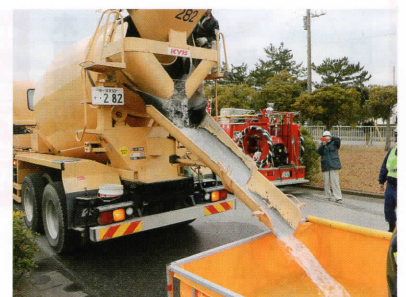
消防用水の確保を目的に訓練(生コンミキサー車)

訓練では各市の消防団災害対策マニュアルに基づき、隣接消防団組織間相互の連携強化と土気高揚を図ることを目的としました。