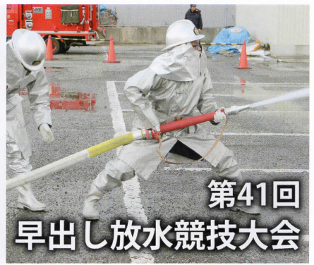
第41回 早出し放水競技大会

平成30年11月4日(日)旧木更津市役所敷地内にて早出し放水競技大会を開催しました。