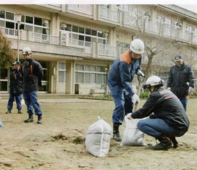
土のう作成設置訓練(富岡小)

あわせて、水災害に備える土のう作りや積み方を、消防職員よりご指導いただきました。