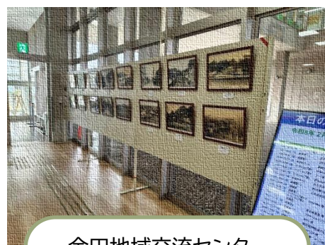
金田地域交流センター

設置作業をしている間にも、公民館等をご利用の方々と写真についてお話しをする機会があり、「母がこのお店に行っていたと話していた」、「この制服はどこの学校だろう」など、会話が弾み、素敵な機会となりました。足を運んでくださった皆さん、ありがとうございました！