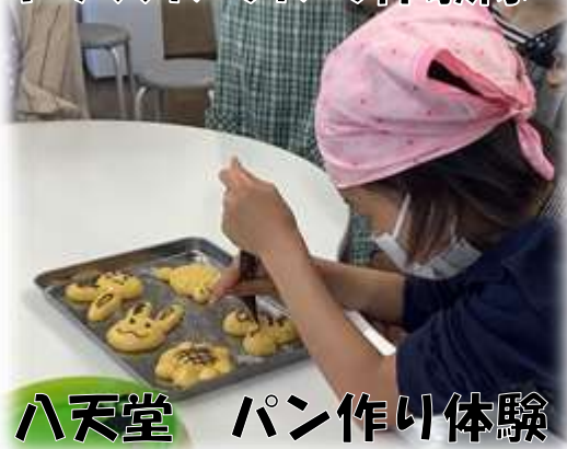
八天堂 パン作り体験