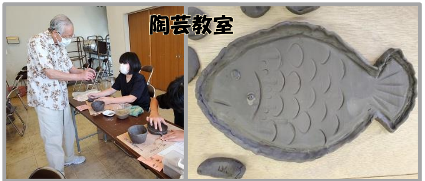
陶芸教室 講師の方に教わりながら、子どもたちは思い思いの作品を作っていました。西清川公民館、陶芸サークルの「陶清」・「とうび」の皆様にご講師をしていただきました。