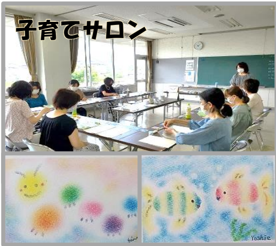
子育てサロン 三色パステルアートの絵はがきを描きました！公民館を利用している「三色パステルアート」の皆様が講師でした。