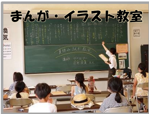
まんが・イラスト教室 4コマまんがに挑戦しました。