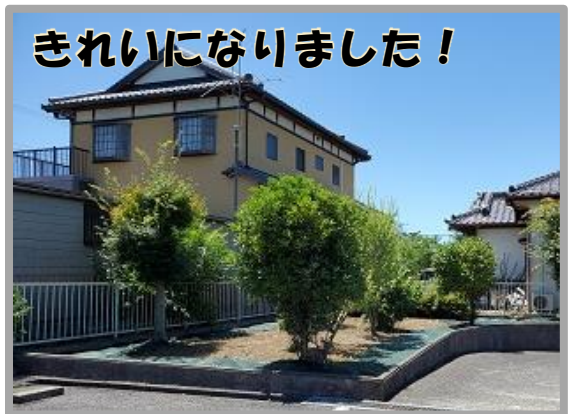
西清川公民館の植栽の一部を剪定・除草しました。民家に隣接する場所には除草シートを張り、再び雑草が生えないようにしました。

10月分の公民館利用申請は、 令和4年9月1日(木) 午前8時30分から 受付を開始します。