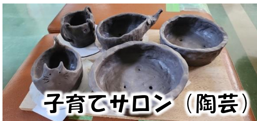
子育てサロン（陶芸）