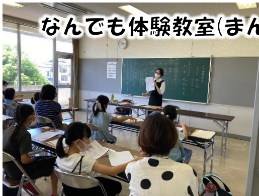
なんでも体験教室(まんが・イラスト体験)