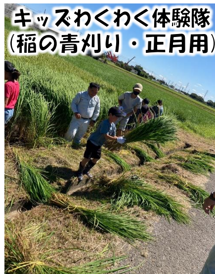
キッズわくわく体験隊 (稲の青刈り・正月用)