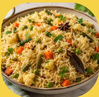
ベジタブルプラオ (炊き込みご飯)