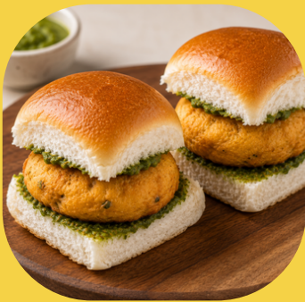
ワダ・パーヴ (インド風コロッケパン)