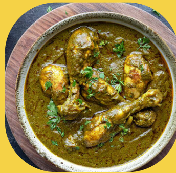
サグチキンカレー (ほうれん草とチキンのカレー)