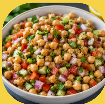
ひよこ豆のサラダ