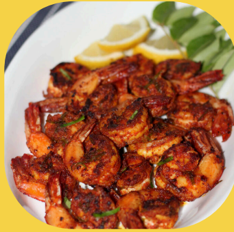
エビのココナッツ炒め