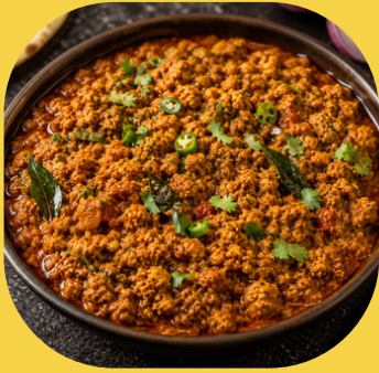
チキンキーマカレー