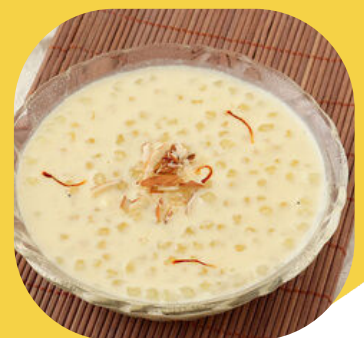
タピオカのキール (ミルク煮)

※アレルギー等への配慮はいたしかねます。メニューをご確認の上、参加をご検討ください。